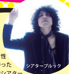
シアターブルック

圧倒的なカリスマ性と独自の感性を持ったギターサウンドでシアターブルックのサウンドを牽引し、作詞・作曲を担当。自らを ROCK STAR と名乗り数多くの Fes や LIVE、チャートを湧かし続けてきた。